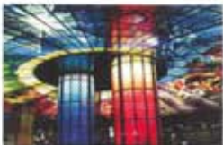
(イメージ) 駅の構内は直径30メートルにわたるステンドグラスのアートが広がる幻想的な空間です