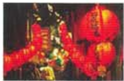
ちょうちんが燈る夕暮れの九份を散策

台湾は、日本からのアクセスが良く、飛行機で東京から4時間。治安も良好で食事美味しく、なにより安い！お手軽に行ける海外旅行として『台湾旅行』は人気があります。B級グルメの宝庫「台湾」、飲茶、茶芸館・中国茶、客家料理、台湾料理、小籠包・餃子・点心などあなたのお気に入り台湾料理を見つけて下さい。ショッピングモールではラグジュアリーブランド・MIT製品・スーパーマーケット…ショッピングもお土産探しもおまかせ！台湾の観光スポットも盛りだくさん！故宮博物院で国宝級の宝物や書画美術品に満喫し、忠烈祠で見事な息の合いっぷりに感動！台湾高速鉄道(台湾新幹線)も2007年に開業して、台北と高雄を約90分で結んでいます