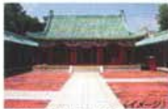
オランダによる植民地支配を終わらせた台湾の英雄、鄭成功が祀られています。